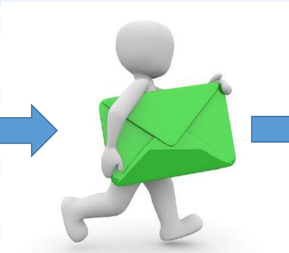
Уведомление о заинтересованности