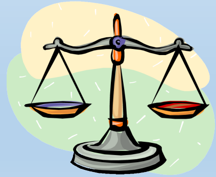
Сделка недействительна, оплата убытков