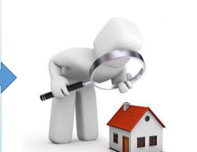
Орган управления или надзора