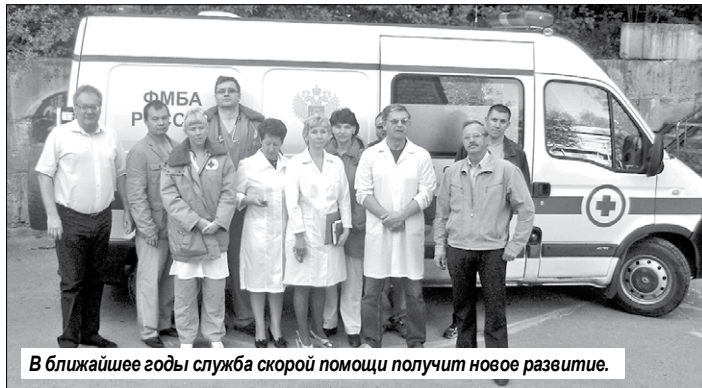
В ближайшее годы служба скорой помощи получит новое развитие.

С развитием и совершенствованием медицинской техники менялось оборудование в МСЧ на новое, современное. За последние годы было приобретено 133 единицы новейшего медоборудования, которое позволяет выявить на ранних стадиях тяжелые заболевания. Комплекс рентгенодиагностический цифровой на 3 рабочих места, цифровой малодозный маммограф, цифровой малодозный флюорограф, эндоскопическая стойка для проведения лапароскопических операций, оборудование для реанимации, для кабинета