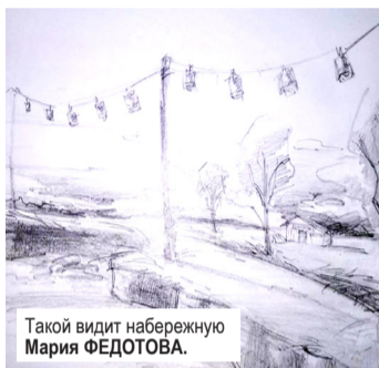
Такой видит набережную Мария ФЕДОТОВА.