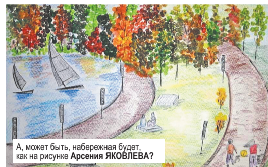
А, может быть, набережная будет, как на рисунке Арсения ЯКОВЛЕВА?

19 февраля администрация ГО Заречный обсудила с архитекторами, какой будущую набережную видят горожане.