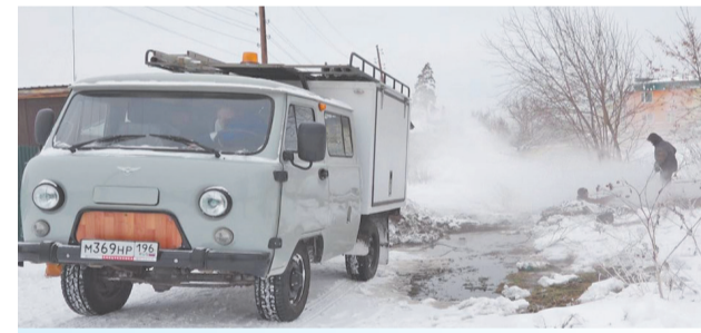
Из-за аварии возле рынка «Апельсин» без тепла остались жители ул. Уральской и частного сектора. Порыв устранили в январе в сильный мороз, и благодаря оперативным действиям «Акватеха» систему отопления домов удалось уберечь от размораживания.

трудятся более 100 человек, и каждый на своем рабочем месте вносит важный вклад в общее дело.