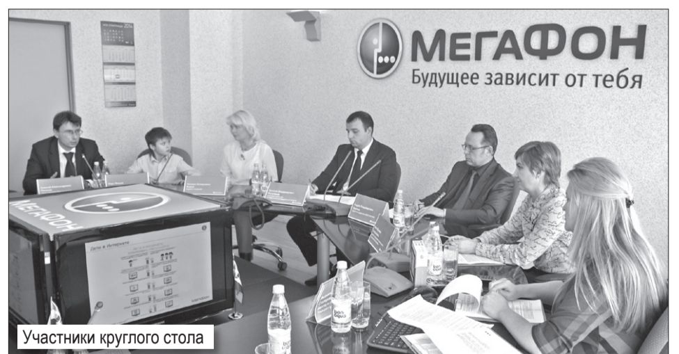
Участники круглого стола

Отметим, что дети в России начинают впервые выходить в глобальную сеть в возрасте 8-10 лет. Причем около 80% из них