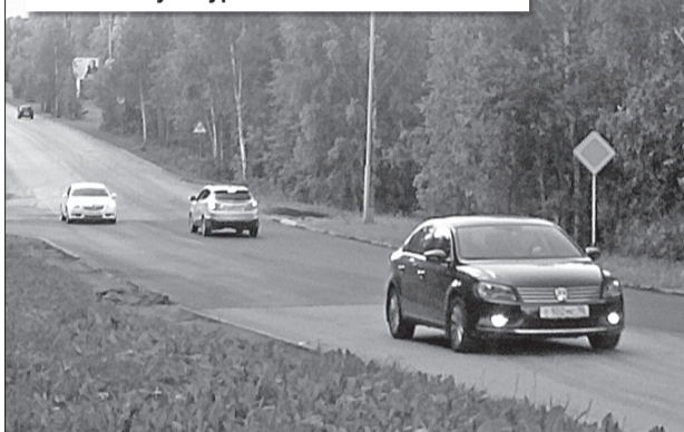
В выходные проведен ремонт дорожного полотна на ул. Курчатова.