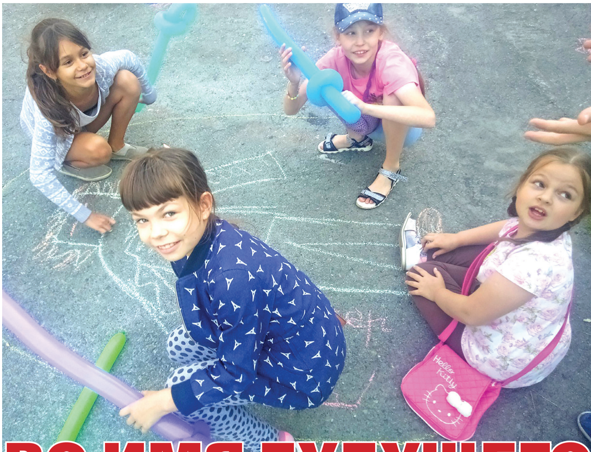
Фото: «Заречный творческий», 2018 год