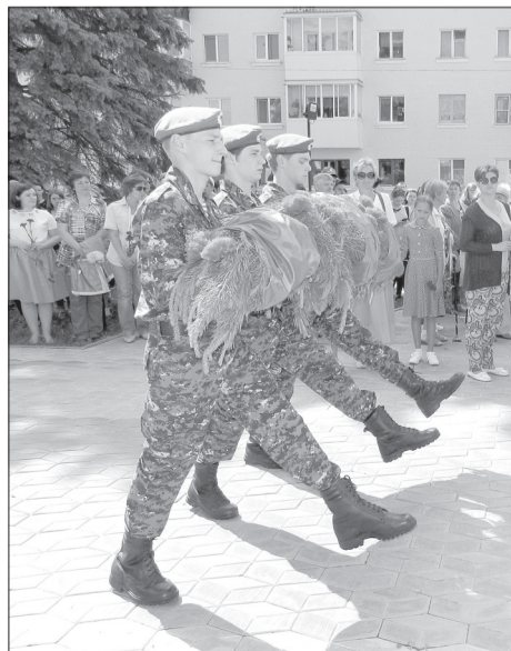
Вечная память павшим! Вечная слава живым!