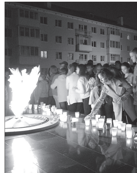
В этом году акция «Свеча памяти» объединила более 300 человек.