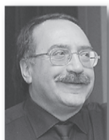
Даниил Крамер, народный артист России:

– В Год культуры в Свердловской области проходит множество знаковых мероприятий. Это и музыкальный фестиваль имени Чайковского в Алапаевске, и музыкальные вечера в дни Ирбитской ярмарки. Фестиваль «URALTERRAJAZZ» повышает привлекательность города Камышлова.