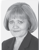
Людмила Бабушкина, председатель Заксобрания Свердловской области:

В течение всего дня на открытых площадках проходили мастер-классы, пешеходные экскурсии по городу, концерты джазовых звёзд Урала и России, зарубежных музыкантов.