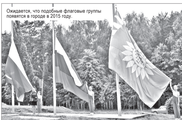
Ожидается, что подобные флаговые группы появятся в городе в 2015 году.

Идея с флагами обсуждалась на заседании Межведомственного совета по гражданско-патриотическому воспитанию населения, где прозвучали предложения организовать флаговые группы у памятника Лучшему солдату в мире (ул. Курчатова 31/3), а также в районе Сквера Победы. В итоге