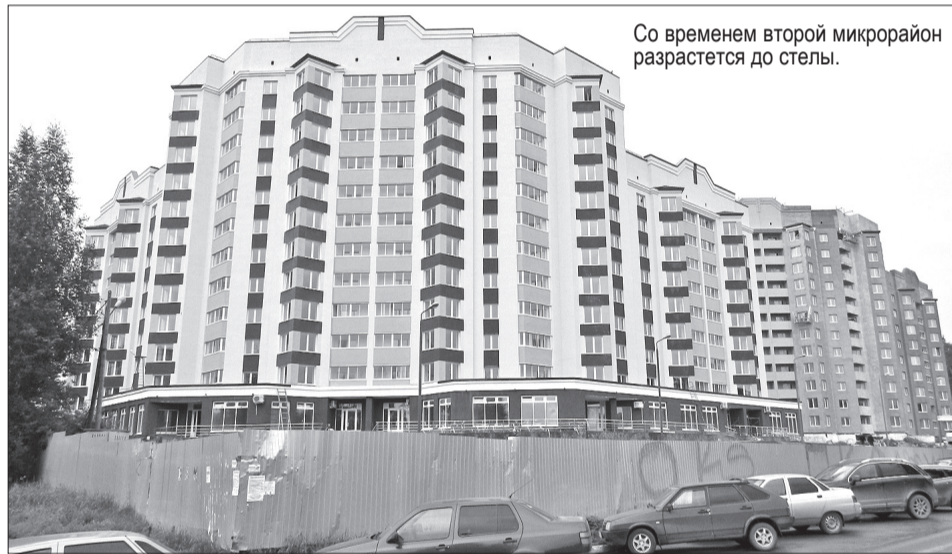
Со временем второй микрорайон разрастется до стелы.