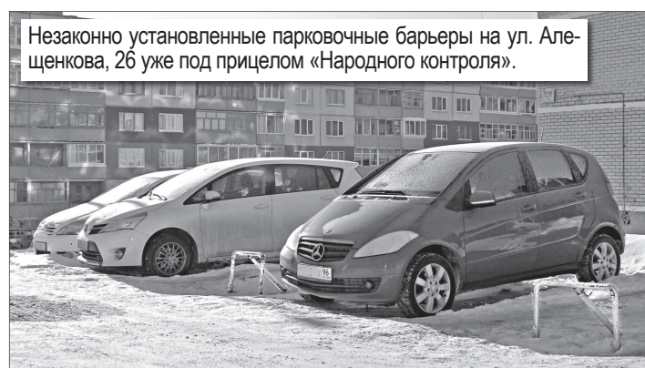
Незаконно установленные парковочные барьеры на ул. Аленкова, 26 уже под прицелом «Народного контроля».

Нарушая данную норму, граждане нарушают Правила благоустройства, то есть совершают административное правонарушение — на это указывает Закон от 14 июня 2005 года №52-ОЗ «Об административных правонарушениях на территории Свердловской области». П. 1 ст. 17 данного Закона («Нарушение правил благоустройства территорий населенных пунктов») предусматривает ответственность за нарушение установленных нормативными правовыми актами органов местного самоуправления Правил благоустройства (если эти действия (бездействия) не содержат деяния, ответственность за соверше-