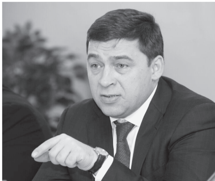
Евгений Куйвашев, губернатор Свердловской области: «Жду от глав действенных мер по снижению задолженности. Предупреждаю, что мы проанализируем ситуацию и динамику работы в разрезе каждого муниципалитета и примем соответствующие решения».

Средства областного бюджета приходится направлять на погашение долгов муниципалитетов за топливно-энергетические ресурсы, вместо того, чтобы направлять их на подготовку жилого фонда и сетей к отопительному сезону. Говоря об этом, губернатор Свердловской области Евгений Куйвашев поручил министерству энергетики и ЖКХ провести тщательный анализ в работе каждого муниципалитета-должника.