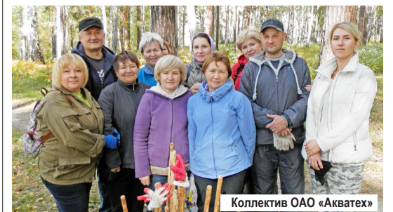
Коллектив ОАО «Акватех»

Так, работники Белоярской АЭС организовали сбор мусора на прибрежной зоне от плотины гидроузла до «Ривьеры». Сотрудники «Института реакторных материалов» наводили порядок в лесопарковой зоне от ул. Мира до стелы. Лесопарк от почты до Ленина, 26 убирал «Акватех», лесной массив по ул. Курчатова-Кузнецова – МКУ «ДЕЗ», а участок леса от Дома торговли до Храма Покрова Божией Матери – сотрудники городской администрации. На сельской территории уборка была организована МУП «Единый город». А работники ООО «Техпромресурс – плюс» ликвидировали несанкционированную свалку в районе очистных сооружений. Приняли участие в экологическом субботнике и сотрудники детского сада «Маленькая страна». Всем участникам субботника большое спасибо за работу и неравнодушное отношение к родному городу!