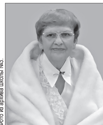
Фото из архива школы №3.