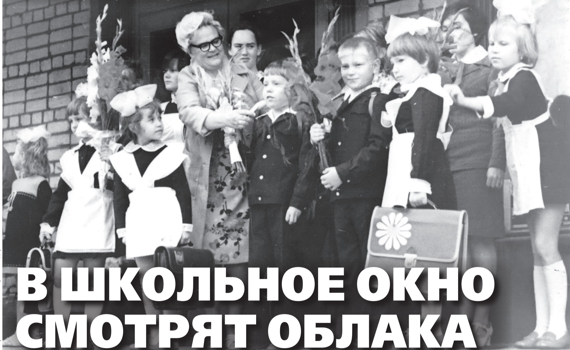
Фото из архива Г. ЧИЧКАНОВОЙ (1970-е годы).

Воспоминания о школе отзываются светлым чувством в душе каждого. В нашей памяти это уютные классы, исписанная мелом доска, потерянный где-то дневник, заботливые и строгие учителя, первая влюбленность, школьный двор, где по осени яблони роняют листву... С щемящей ностальгией выпускники школы №3 вспоминают сегодня то время, когда сидели за партой. Первого сентября их родной альма-матер исполняется 45 лет!