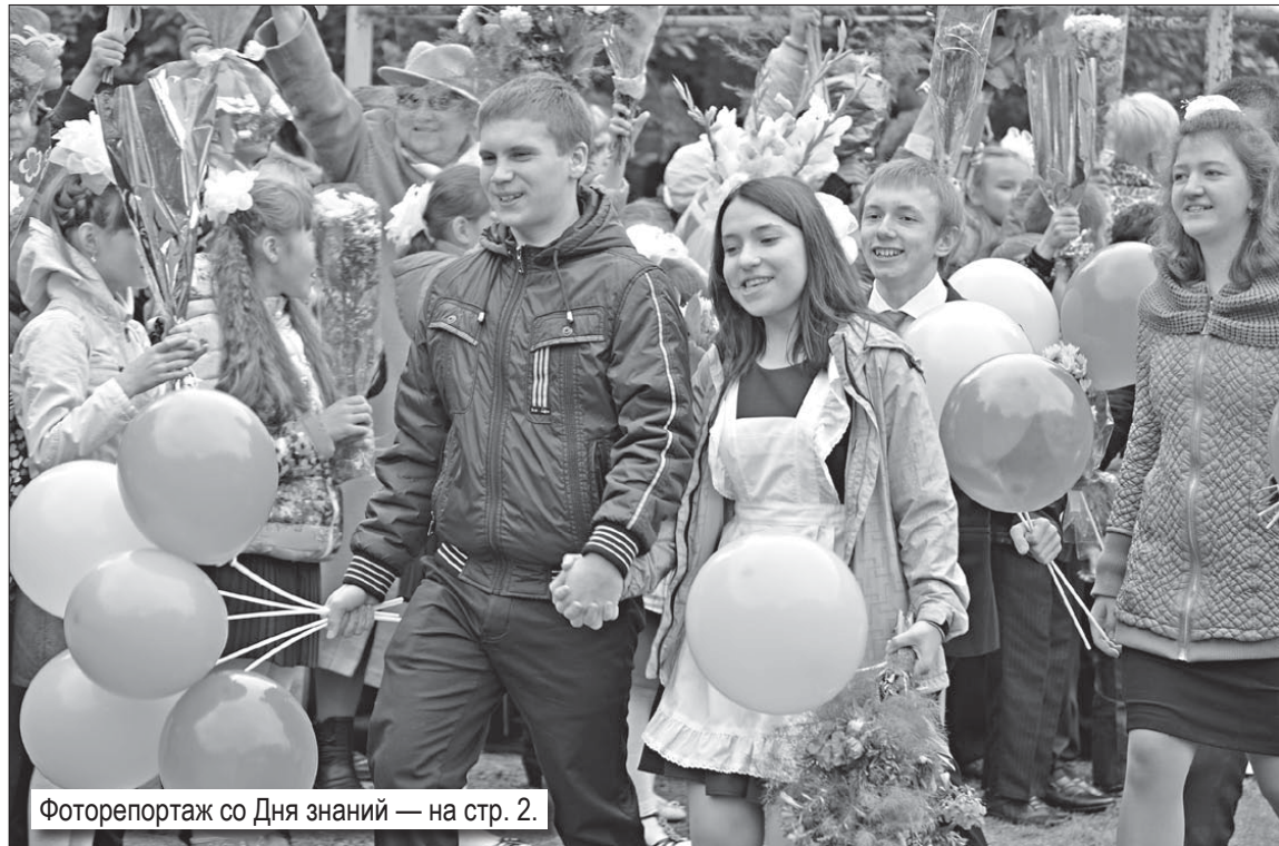
Фоторепортаж со Дня знаний — на стр. 2.

На этой неделе в Заречном прошли торжественные линейки, посвященные Дню знаний. И вновь стены образовательных учреждений оживили радостные голоса учеников, в классах зашелестели страницы учебников и тетрадей. Наступил новый учебный год!