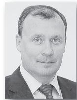
Алексей Орлов, первый заместитель председателя правительства Свердловской области – министр инвестиций и развития:

«Главное – всё, что мы обещаем людям, должно быть исполнено. Пасовать перед временными трудностями мы не будем, у нас достаточно сил, средств, политической воли, чтобы продолжать курс на качественное развитие региона, достижение нового качества жизни уральцев».