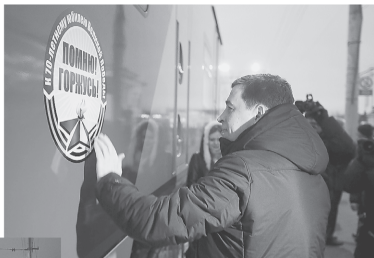
Ко дню рождения области встал на рельсы электропоезд «Ласточка», произведенный на предприятии «Уральские локомотивы». В первое путешествие до Верхотурья поезд отправился с символической наклейкой, приуроченной к 70-летию Победы в Великой Отечественной войне. Губернатор лично наклеил на кабину машиниста стикер «Помню! Горжусь!». Так Евгений Куйвашев поддержал акцию, организованную активистами из Берёзовского, и предложил сделать её областной.

На протяжении всей своей истории Средний Урал был одним из ведущих индустриальных регионов страны, внёсших огромный вклад в развитие отечественной промышленности, науки и культуры. Об этом сказал губернатор Евгений Куйвашев, поздравляя уральцев с 81-й годовщиной со дня создания Свердловской области.