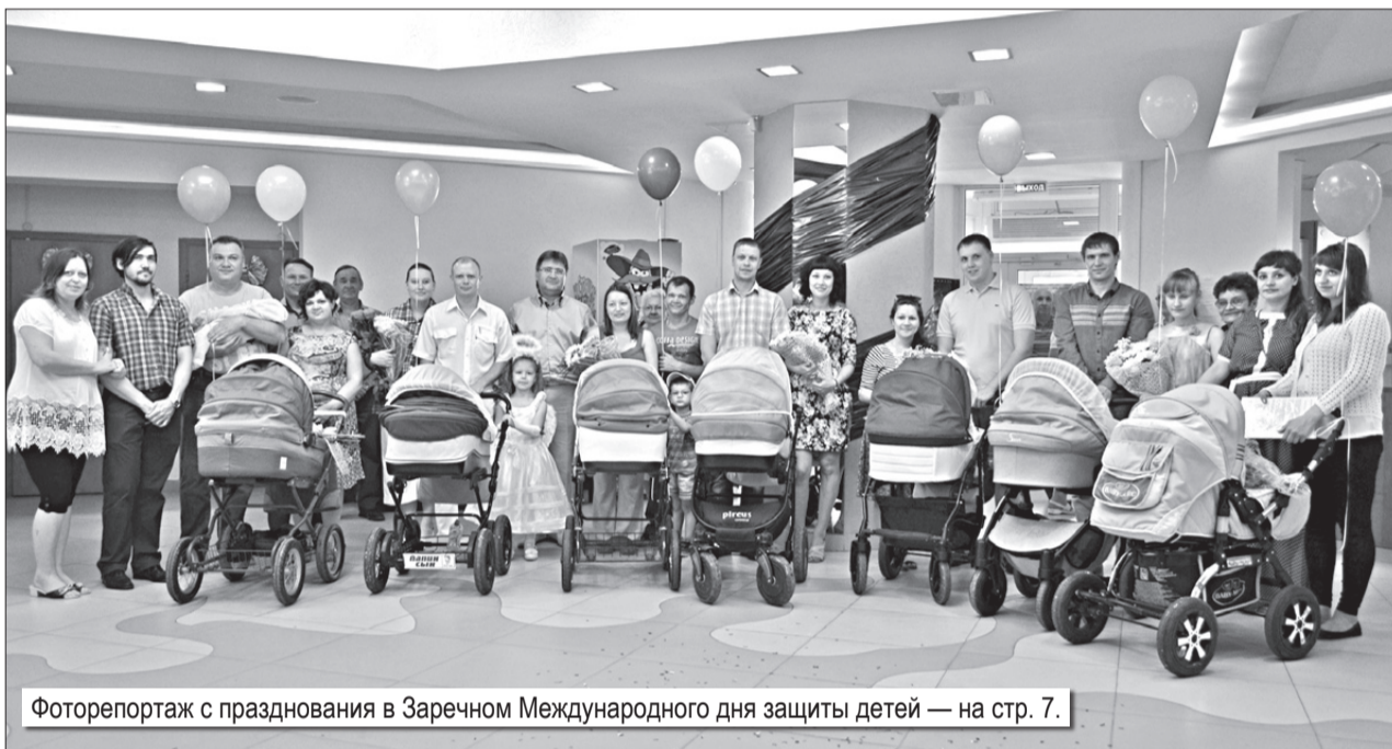
Фоторепортаж с празднования в Заречном Международного дня защиты детей — на стр. 7.

Согласно указу Президента России Владимира ПУТИНА, в 2015 году должны быть ликвидированы очереди в детские сады для детей в возрасте от 3 до 7 лет. Решение этого вопроса в Свердловской области находится на личном контроле губернатора Евгения КУИВАШЕВА. На образование приходится около трети всех бюджетных расходов региона: в 2015 году на эти цели предусмотрено 42,6 млрд рублей (на 3 млрд больше, чем годом ранее), на развитие сети детских дошкольных учреждений — 4,8 млрд рублей. До конца года в области будет построено и реконструировано 73 детских сада, это позволит дополнительно создать свыше 14000 мест в ДОУ.