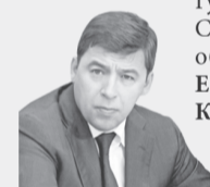
Губернатор Свердловской области Евгений Куйвашев :

«Нам необходимо создать туристические маршруты и качественную инфраструктуру, чтобы люди приезжали к нам не просто на отдельное событие, а оставались здесь на длительное время, и мы смогли бы раскрыть им все возможности Урала».