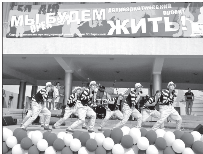
Не исключено, что проведение фестиваля-акции «Мы будем жить!» станет для Заречного доброй традицией. Организаторы планируют сделать его ежегодным — так же, как в Екатеринбурге и Ревде.