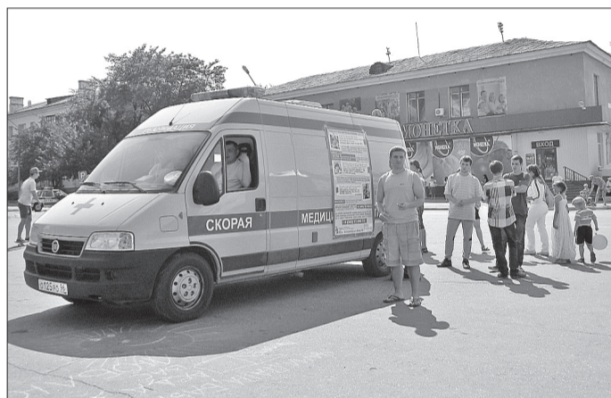
В рамках акции на площади было организовано анонимное экспресс-тестирование на ВИЧ. Проверить себя на смертельный вирус отважился 51 человек. К счастью, все результаты оказались отрицательными.

Об этом — о выборе, надежде, вере в новый день — говорили в минувшую субботу на празднике, посвященном Всемирному дню борьбы с наркоманией и Дню молодежи России. Фестиваль-акция «Мы будем жить!» проводился в нашем городе второй раз. Его неизменным организатором является местное отделение Фонда социально-реабилитационных центров «Дорога к жизни». Фонд был создан в 1999 году и с тех пор занимается профилактикой наркомании, реабилитацией наркозависимых и помогает семьям, оказавшимся в трудной жизненной ситуации (всего в Свердловской области 5 филиалов Фонда, в том числе 1 в Заречном).