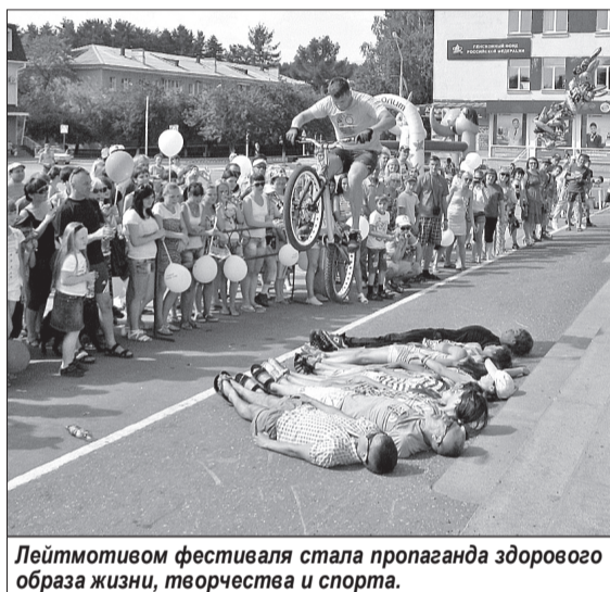
Лейтмотивом фестиваля стала пропаганда здорового образа жизни, творчества и спорта.