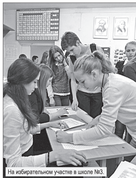
На избирательном участке в школе №3.

Выборы в Молодежный парламент Свердловской области, прошедшие 11 декабря, — уже третьи по счету: первые состоялись в 2011 году, вторые — в 2013. И вот очередная избирательная кампания. Поддержка ей была оказана на самом высоком уровне: начиная непосредственно с Заксобраний и Избирательной комиссии Свердловской области, которые являются главными организаторами выборов, областного Министерства физической культуры, спорта и молодежной политики, оказывающего проекту информационную и административную поддержку, и заканчивая территориальными избирательными комиссиями и молодежными избирательными комиссиями, которые провели всю работу на местах.