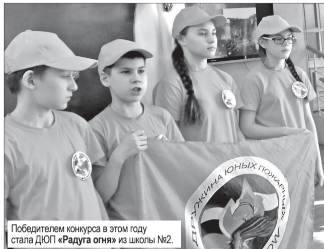
Победителем конкурса в этом году стала ДЮП «Радуга огня» из школы №2.

16 марта в Центре детского творчества г. Заречный прошел Городской конкурс среди дружин юных пожарных образовательных учреждений. В нем приняли участие ДЮП «Фортуна» (школа №1), «Радуга огня» (школа №2), «Спрайт» (школа №3), «Зажигалки» (школа №4). Обстановку в зале была праздничной, но и напряженной. Всем хотелось выиграть и занять призовое место.