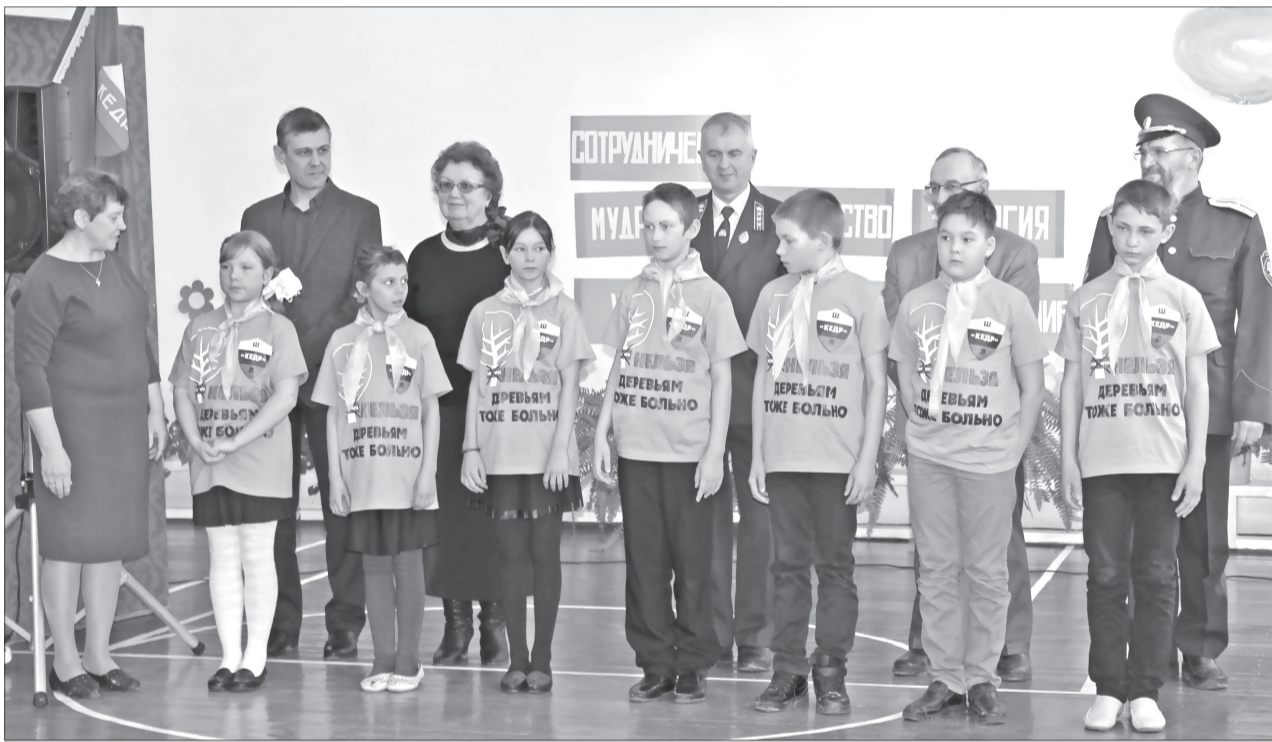
В честь празднования 20-летия в ряды «Кедра» торжественно приняты 7 мальчишек и девчонок, которым 18 марта почетные гости праздника повязали зеленые галстуки.