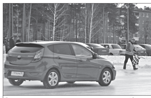
В традиционных автмотогонках приняли участие 56 человек. Все призовые места заняли зареченцы.