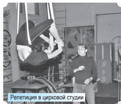
Репетиция в цирковой студии