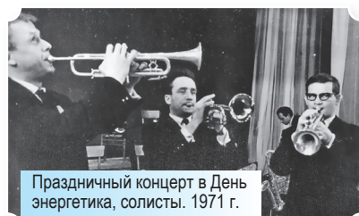
Праздничный концерт в День энергетика, солисты. 1971 г.

Всё, о чём мы сегодня рассказываем, — это лишь малая толика бурной, энергичной, творческой, победной жизни Дворца за прошедшие 55 лет. А впереди у нас — новые яркие события, достижения и, конечно, рассказы об отдельных коллективах и людях «Ровесника».