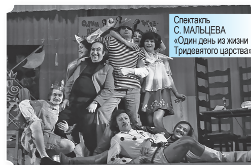
Спектакль С. МАЛЬЦЕВА «Один день из жизни Тридевятого царства»