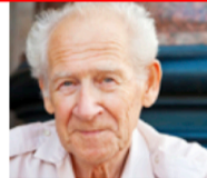
видео с кратким рассказом