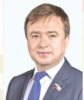
Депутат Государственной Думы М. А. ИВАНОВ