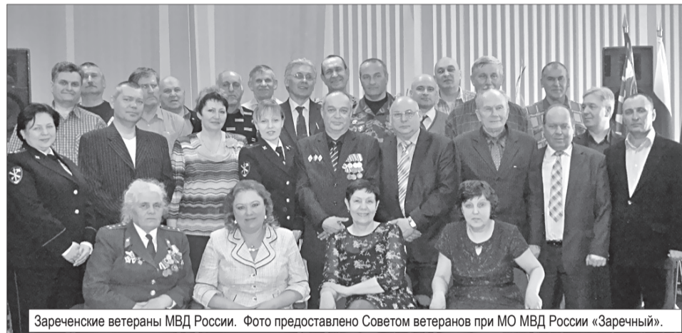
Зареченские ветераны МВД России.

До 2011 года профессиональный праздник, отмечаемый ежегодно 10 ноября, назывался Днем милиции (да и сегодня многие по привычке продолжают его так именовать). Сейчас у него новое название – День сотрудника органов внутренних дел Российской Федерации. А сама история этой государственной структуры началась с далекого 1715 года – именно тогда российский император Петр I создал в нашей стране службу охраны общественного порядка и назвал ее «полицией», что в переводе с греческого означает «управление государством».