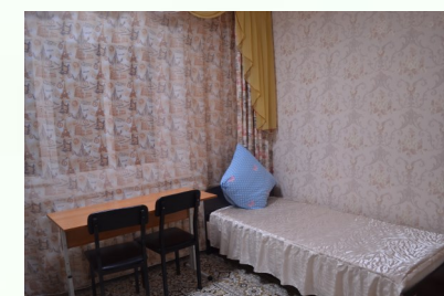
ЖИЛАЯ КОМНАТА ДЛЯ ПОЛУЧАТЕЛЕЙ СОЦИАЛЬНЫХ УСЛУГ КРУГЛОСУТОЧНОГО ПРЕБЫВАНИЯ

Мы ждем Вас по адресу: ХМАО - Югра, Октябрьский район, п. Сергино, ул. Центральная, д. 18, телефоны: 8 (34678) 3-41-74, 3-40-43, 2-13-88