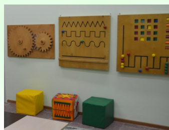
Комната ОКУПАЦИОНАЛЬНОЙ ТЕРАПИИ реабилитация несовершеннолетних, которые по состоянию здоровья нуждаются в помощи при уходе за собой, проведении досуга и выполнении трудовой деятельности