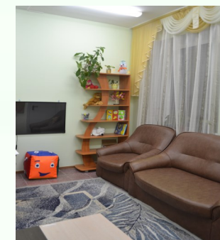
Кабинет профессиональной реабилитации инвалидов