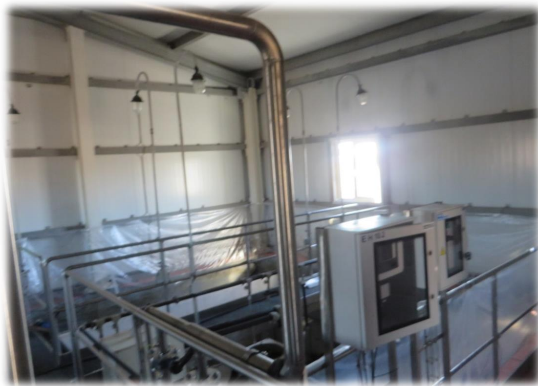
Рисунок 5. Установка анаэробного окисления аммония

Производительность по притоку стока Q_{24}=370 \text{ м}^3/\text{сут} , Q_{\text{max}}=23,12 \text{ м}^3/\text{ч} , Q_{\text{max}}=6,4 \text{ л/сек} .