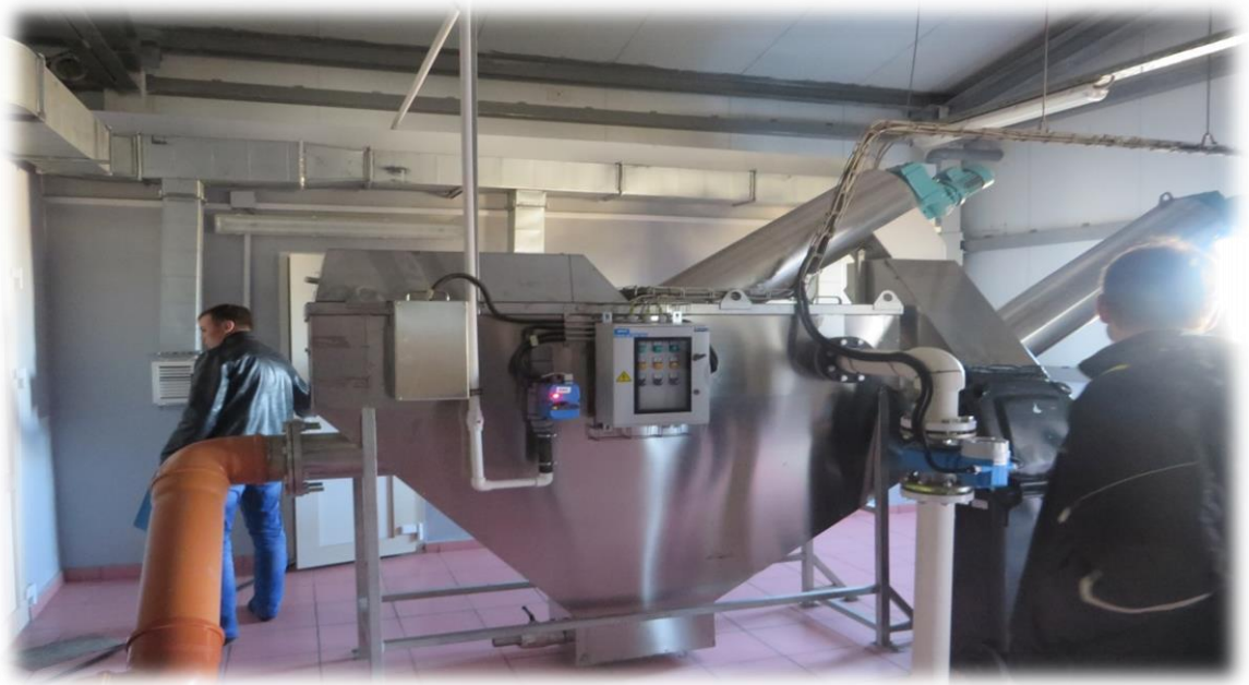
Рисунок 3. Устройство грубой предочистки