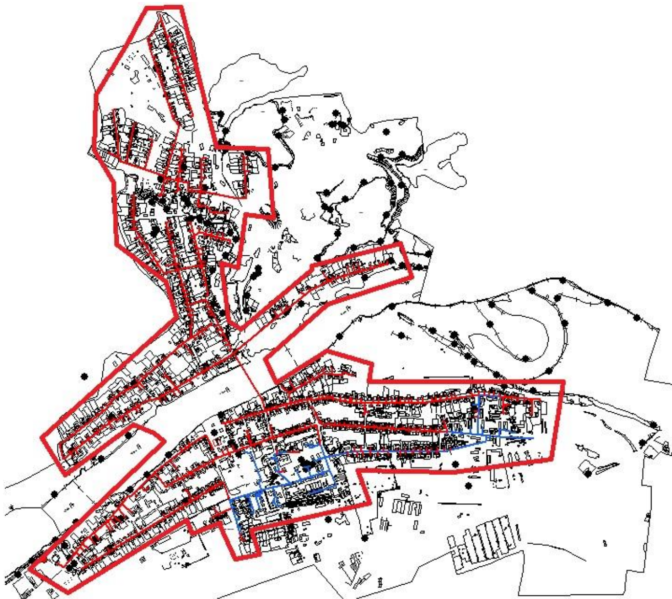
Рисунок 8. Зона перспективного охвата системы централизованного водоотведения

Перспективная структура централизованной системы водоотведения Махнёвского муниципального образования с разделением на технологические зоны представлена на рисунке 8: