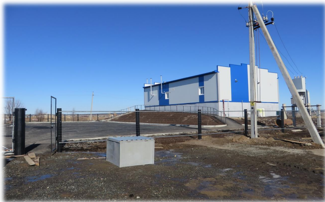
Рисунок 1. Общий вид очистных сооружений в п. Махнёво

Централизованная система сбора бытовых стоков на территории Махнёвского муниципального образования существует только в п. Махнёво (Рисунок 1). Протяженность сетей хозяйственно-бытовой канализации составляет 7,47 км. Хозяйственно-бытовой канализацией обеспечена 42,5% населения п. Махнёво. Остальная застройка (57,5 %) оборудована надворными уборными.