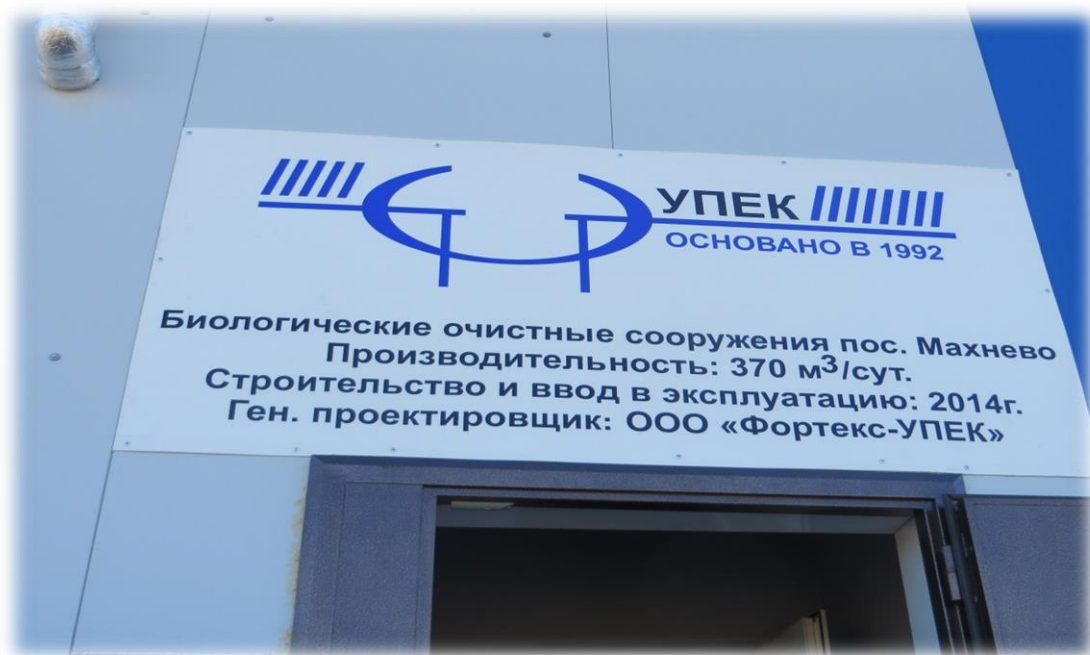
Рисунок 2. Очистные сооружения ООО «Фортекс-УПЕК»

Для очистки сточных вод в п. Махнёво построены очистные сооружения полной комплектационной поставки фирмы «Фортекс», Чехия (Рисунок 2). Имеют российские сертификаты и санитарно-гигиеническое заключение. Технология очистки воды ООО «УПЕК» также имеет санитарно-гигиеническое заключение.