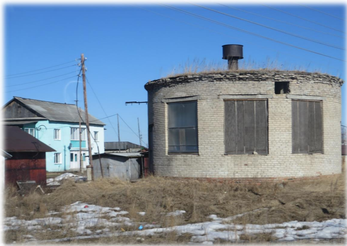
Рисунок 6. Третья КНС на ул. Победы

Зона действия централизованного водоотведения в п. Махнёво показана на рисунке 7: