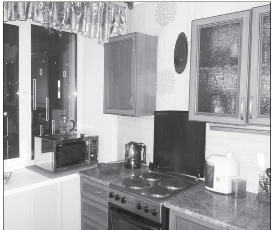
Теперь жители улицы Декабристов могут быть спокойны за свою бытовую технику