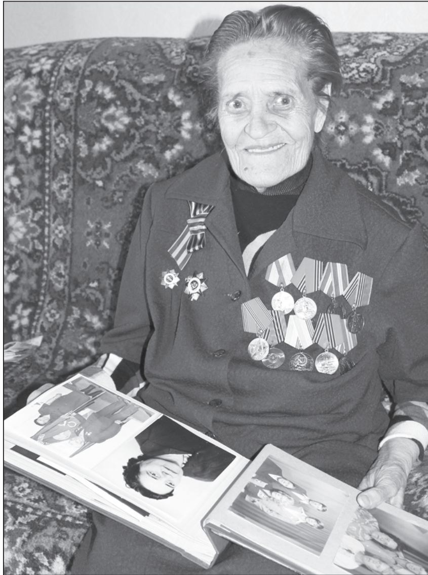
Несмотря на страшные страницы биографии, 91-летняя фронтовичка сохранила добрый нрав и оптимизм

Среди прочих воспоминаний сохранилась в памяти история с бомбой, которую неопытные девчонки принесли в сторожку, чтобы ис-