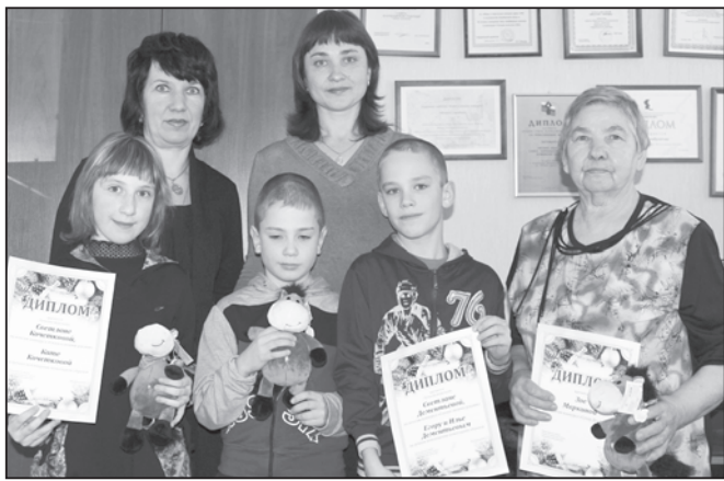
"КАРАБАШСКИЙ РАБОЧИЙ" - городская газета, выходит с 15 июня 1929 года

Итоги подведены. Среди огромного количества писем и фотографий выбрать победителей было очень непросто. Все костюмы заслужили внимания и похвалы, ведь все они были сделаны с выдумкой и фантазией. Воспоминания Дедов Морозов было действительно интересно читать. Лучшие работы конкурсантов мы публиковали на страницах газеты. Победителей пригласили в редакцию, где им вручили заслуженные дипломы и приятные сувениры. Веселые Лошадки будут весь год дарить хорошее настроение и обязательно принесут удачу.