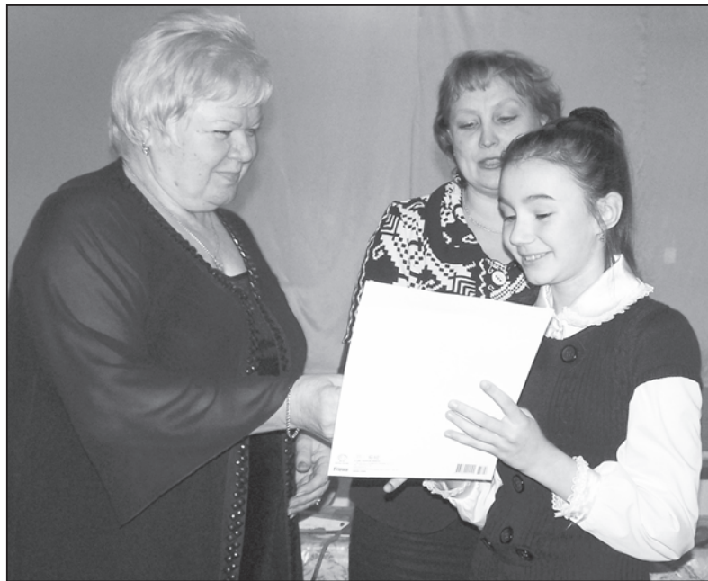
Победители научно-практической конференции награждены дипломами и памятным призами городского Управления образования

Научно-практическая конференция "Первые шаги в науку" в очередной раз определила победителей в разных областях знаний. Ребята много и результативно поработали, получили массу новой информации, которую сумели интересно представить в своих проектах. И независимо от того, стали они победителями или нет, каждый из участников достиг многого - он получил знания.