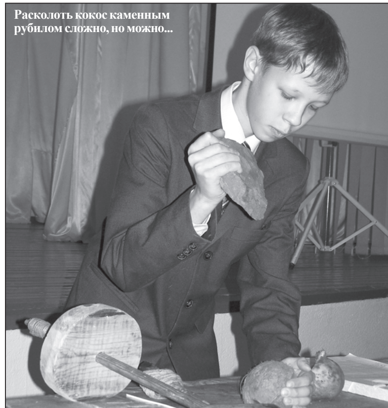
Расколоть кокос каменным рубилом сложно, но можно...

Школьники исследуют свойства углерода, способы варки мыла и древние орудия труда