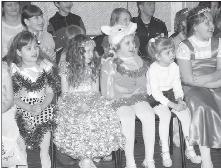
Кого только не встретишь на новогоднем празднике: лисичка, принцесса, Василиса Прекрасная и др.