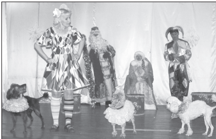
Дрессированные пудели вызвали особый восторг у детворы