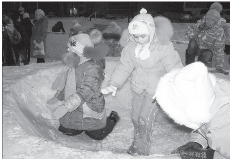
В чаше ледовой играй осторожно! Стоять на ногах в ней невозможно!