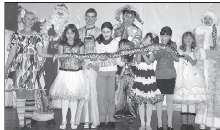
Подержать в руках питона решились не многие