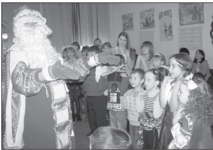
Дед Мороз: "Делай как я!"