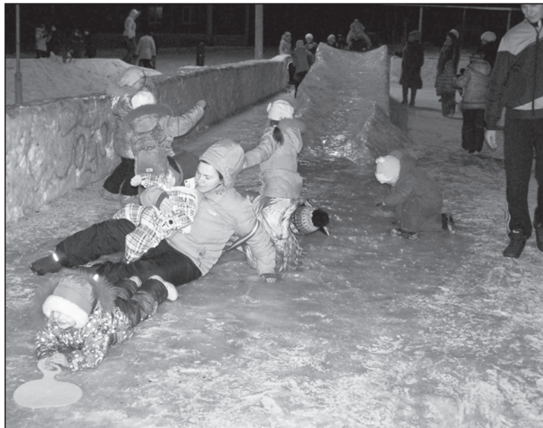
Как интересно, братцы, с горки ледяной кататься!