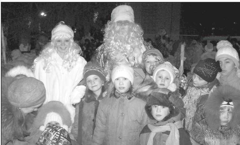
Добрый Дедушка Мороз никому не щиплет нос!