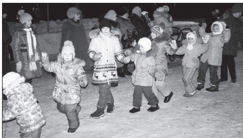
В новый год честной народ встал в веселый хоровод