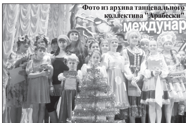
Церемония награждения: фото на память

Наиболее успешно выступили младшие "Арабески", которые стали дипломантами первой степени в номинации "Первые шаги". Руководитель коллектива отмечена благодарственным письмом.