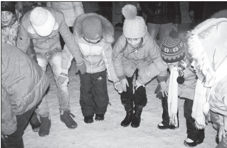
Если весело живется - делай так!

Для детворы на Аллее ветеранов были обустроены ледовые горки, с которых мальчишки и девчонки лихо скатывались на санках-ледяных. Особенно привлекла ребят горка, наверху которой вместо площадки была устроена скользкая ледовая чаша, где детьми устраивалась веселая возня. А закончился праздник ярким новогодним фейерверком.