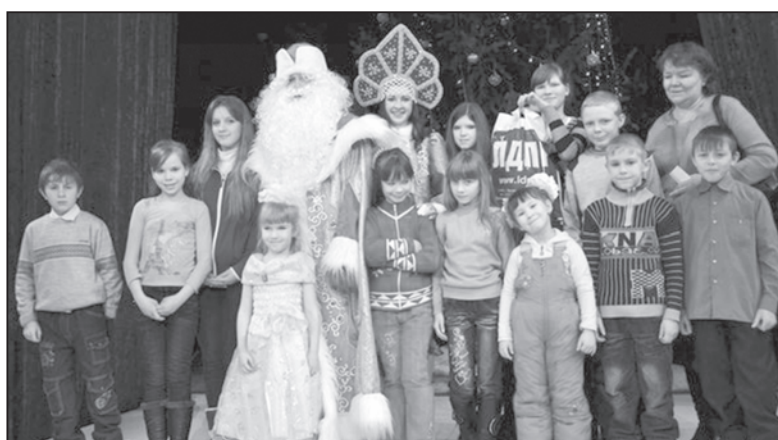
Десять ребят из детского дома побывали в Челябинском театре "Манекен".