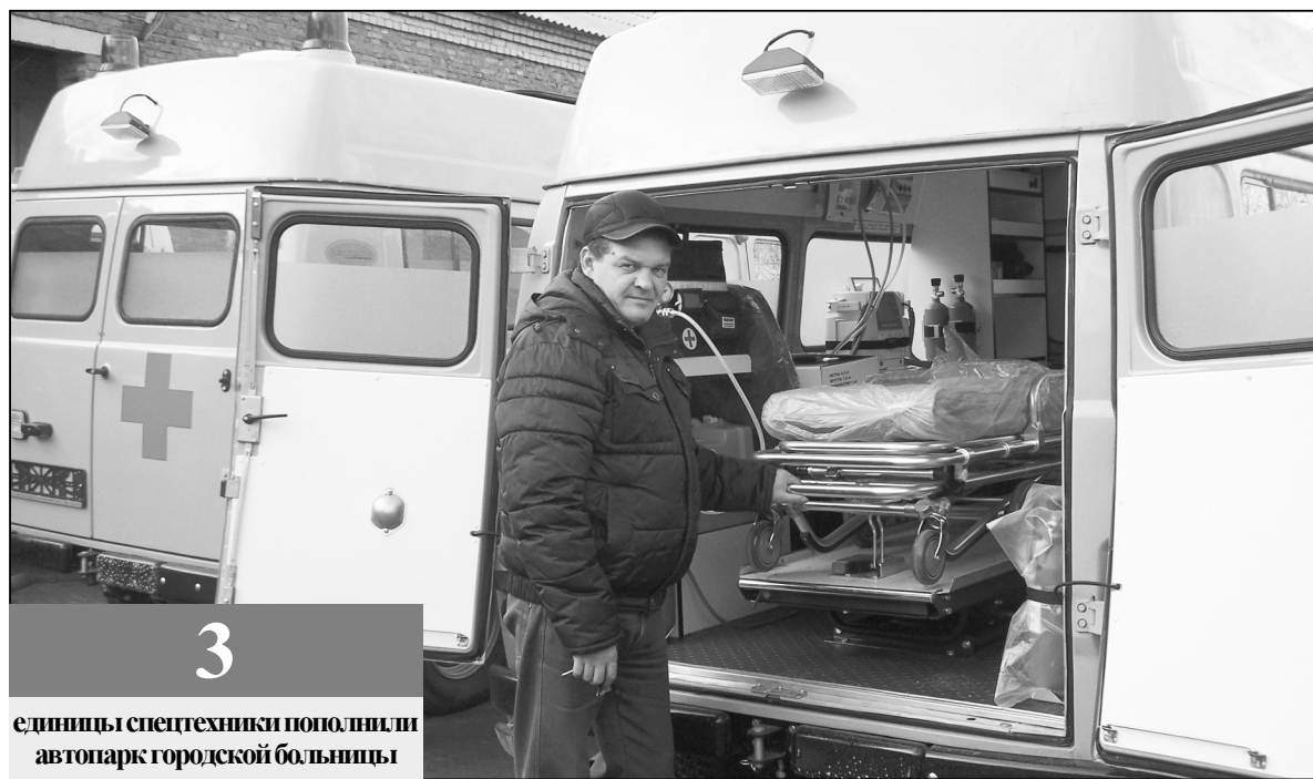
3 единицы спецтехники пополнили автопарк городской больницы

Благодаря новым спецавтомобилем повысится оперативность и качество медицинского обслуживания