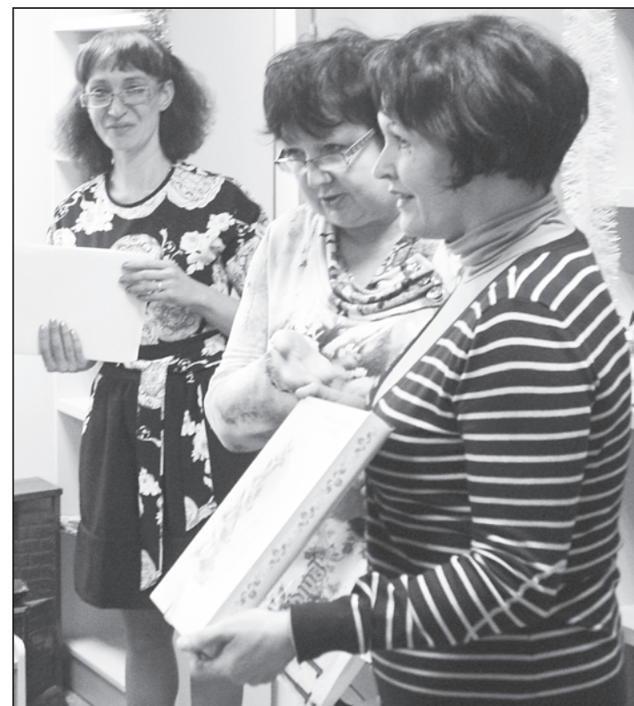
Самые добрые пожелания адресовали гости библиотеки её сотрудникам

Теплые воспоминания хранят сердца женщин - участниц