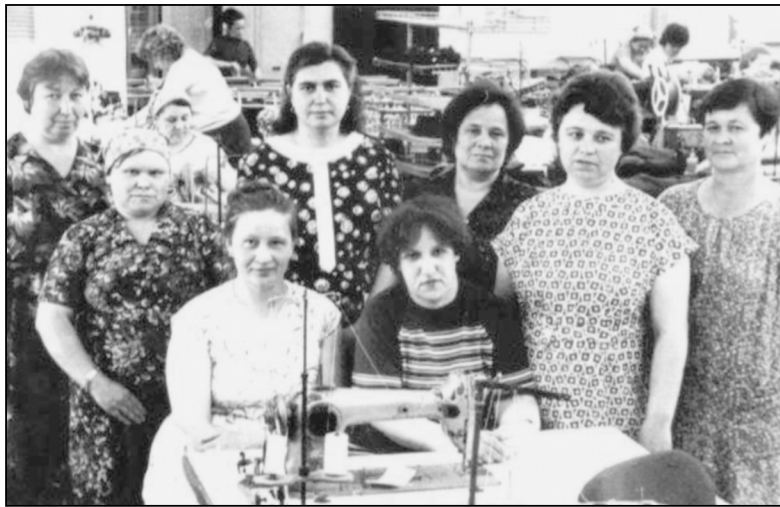
В цехе за работой