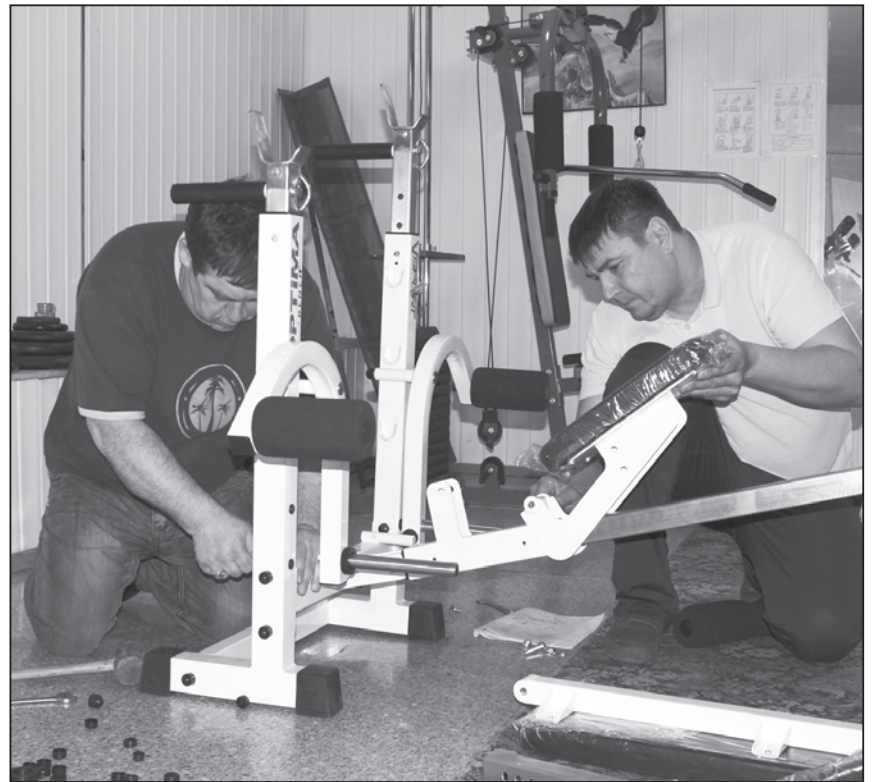
Идёт сборка новых тренажеров

Появились обновки и в зале гиревиков. Так собрана и установлена многофункциональная стойка. Ее конструкция сводит на нет возможность получить травму при тренировках самых