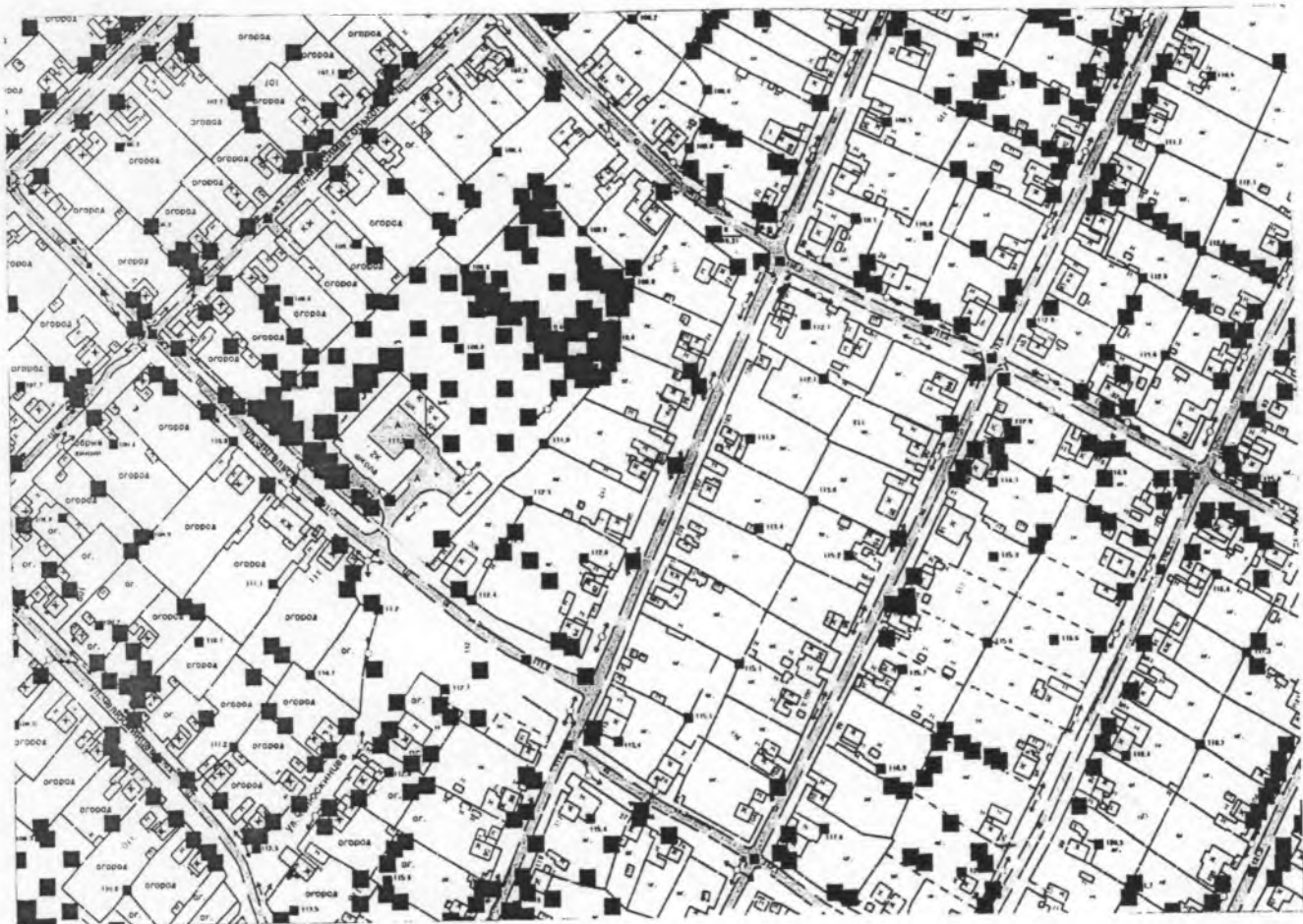
Схема расположения и установки дорожных знаков в г. Новая Ляля перекрёсток ул. Клары Цеткин-ул. Кима

1. дорожный знак 2.1 «Главная дорога» - 2 шт.