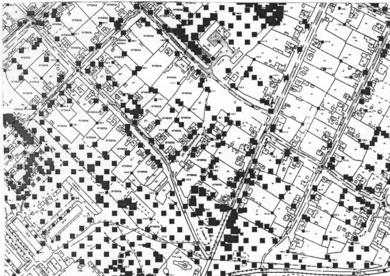
Схема расположения и установки дорожных знаков в г. Новая Ляля перекресток ул. Клары Цеткин-ул. Энгельса

1. дорожный знак 2.1 «Главная дорога» - 2 шт.