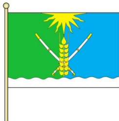
Флаг Кочубеевского муниципального района Ставропольского края