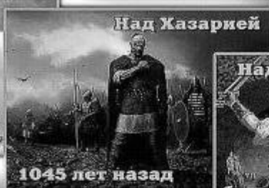
1045 лет назад