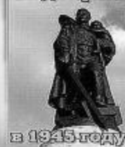
в 1945 году