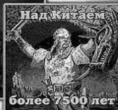
более 7500 лет