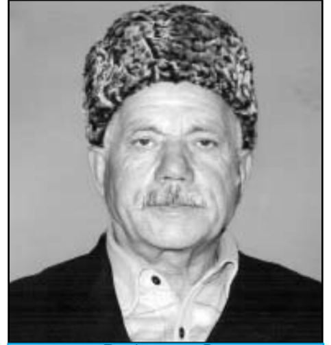
Росдал шагІур XI ГъазимухАмадов

васал ва ясал руго батІибатІиял бакІазда тохтурзабилъун цІалулел ва хІалтІулел. 1970 соналъ мундерил Кардоналдаса, багІараб къоде швезегІан (8 км. 800 метр халалъи бугеб), ГІахъвахъ ва Цумада районозде нух къокъ гъабун бахъана Кванхидаль росулъан. Гъев хІалтІуль бажари ва жигарчилъи бихъизабуна Цумада районлъул Гъаквари росулъа ИзмагІилов Супяница (мунагІал чураяв). Гъев нух рагъаралдаса кванхдерие рес швана тІубанго росу, хур, ах цІи гъабизе, бечедго ГІумру гъабизе. Машинадул кумек шведаль ГІемерал цІиял минаби рана росулъ. Ахириял соназ цІидасан къачІана росдал клуб, гІатІид гъабуна школалъул мина ва гъенибго цІияб тІохги лъуна. Росулъе бачана жибго чвахун бачІунеб ва ГІурухъан насосаль къабунеб лъим. Бана медпункт, къачІана рузманалъул мажгит, цІидасан цІана токалъул кварал,