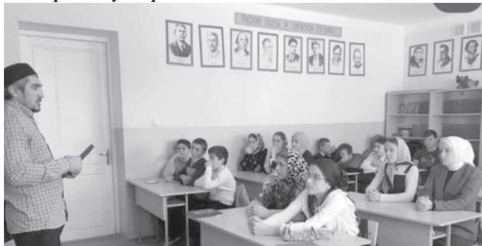
Болъихъ гъоркъохъеб №3 школалда