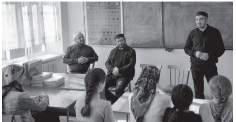
Шодрода гъоркъохъеб школалда