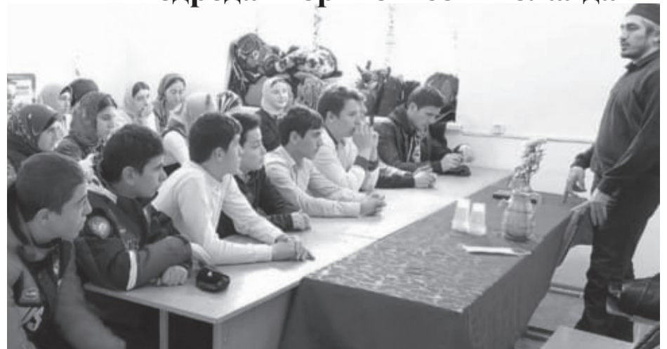
Рахатѳа гъоркъохъеб школалда