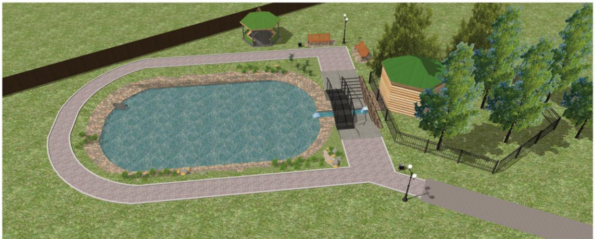
ГЕНЕРАЛЬНЫЙ ПЛАН БЛАГОУСТРОЙСТВА