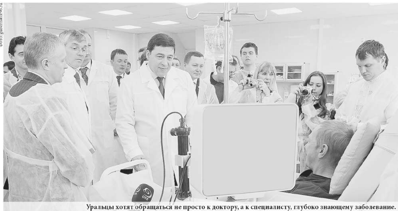
Уралцы хотят обращаться не просто к доктору, а к специалисту, глубоко знающему заболевание.