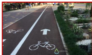
Строительство 2-ой очереди велодорожки «От косы до косы»