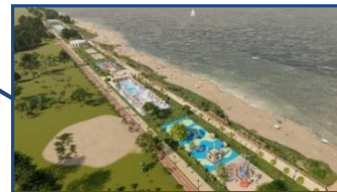
Создание туристско- рекреационного комплекса в г. Зеленоградске (Аллея с фонтанами, «Обустройство общественной зоны отдыха, «Обустройство променада»)