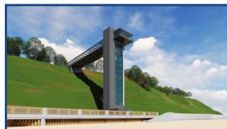
Строительство лифтового подъемника в г. Светлогорске