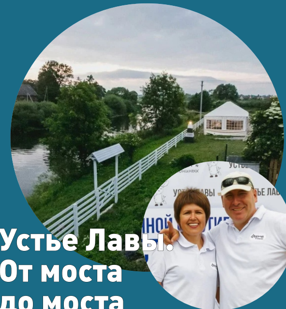
Устье Лавы. От моста до моста