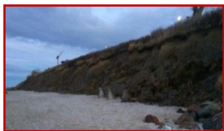
Реконструкция берегозащитных сооружений в г. Зеленоградске