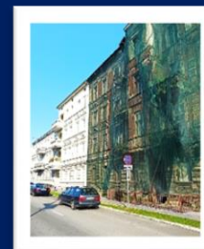
«Жилой дом» начало XX века» (Гусев)