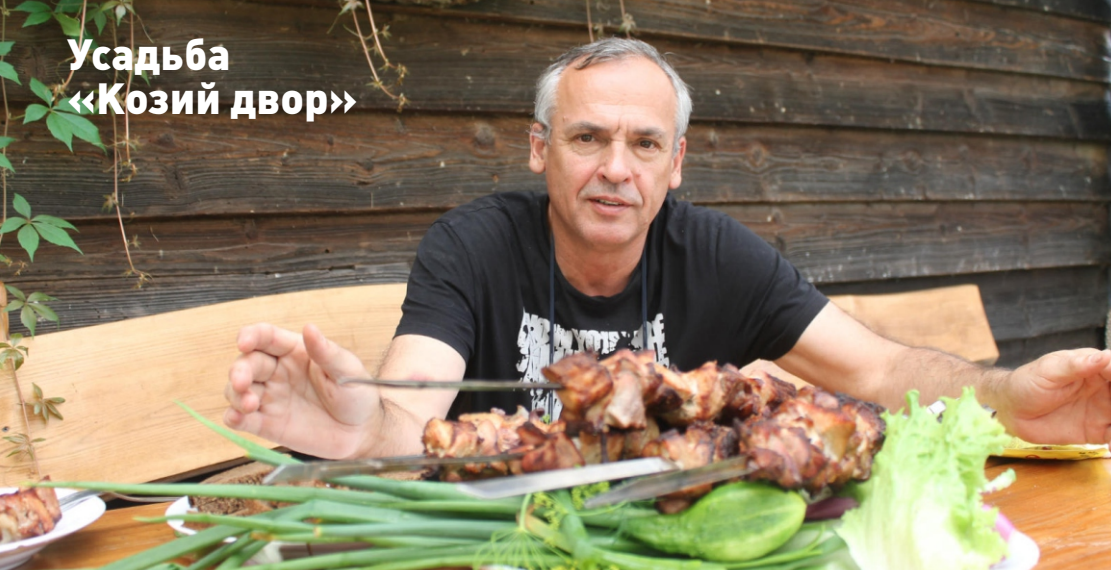
Усадьба «Козий двор»