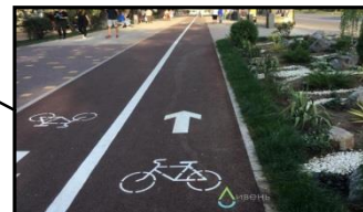
Строительство 1-ой очереди велодорожки «От косы до косы»