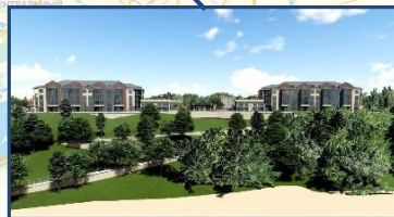
Создание гостиничного комплекса в г. Пионерский