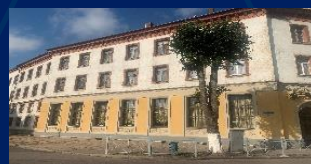
Здание гостиницы Советск