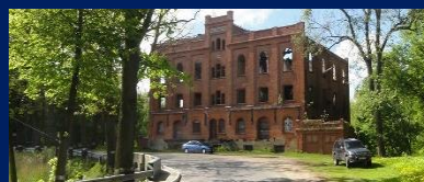
Мельница Гердауэна в пос. Железнодорожный