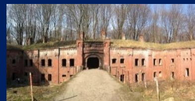
Форт №3 «Король Фридрих III»