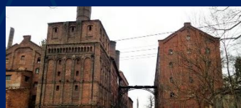
Пивоваренный завод «Понарт»