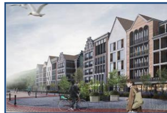
Курортно- оздоровительный комплекс «Променад»