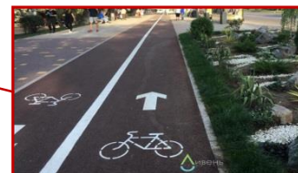
«Куршский велотракт» (велодорожка) на территории Национального парка «Куршская коса»