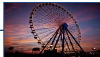
Установка колеса обозрения в г. Зеленоградске