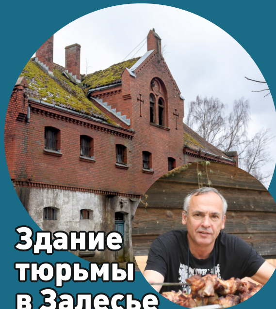
Здание тюрьмы в Залесье