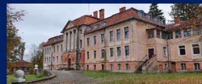
Усадьба Крайсхаус Гердауэна в пос. Железнодорожный