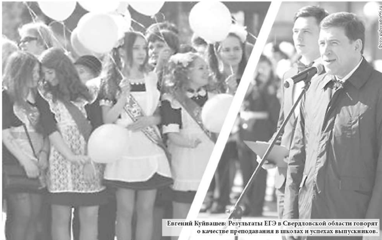
Евгений Куйвашев: Результаты ЕГЭ в Свердловской области говорят о качестве преподавания в школах и успехах выпускников.

«В этом году сохраняется тенденция улучшения результатов по обязательным предметам. Доля выпускников, которые остались без аттестатов, сократилась почти в 1,5 раза».