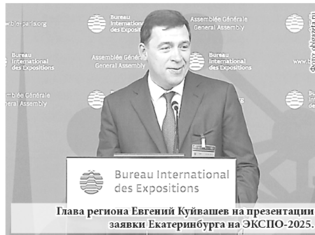
Глава региона Евгений Куйвашев на презентации заявки Екатеринбурга на ЭКСПО-2025.

Согласно планам Международного бюро выставок со 2 мая по 2 ноября 2025 года будет проходить очередная выставка ЭКСПО-2025. Екатеринбург наряду с Парижем, Осакой и Баку подал заявку участника, комиссия по отбору начнёт работу в 2018 году. Заявленная тема Екатеринбурга для конкурса – «Меняя мир: инклюзивные инновации для наших детей и будущих поколений». Депутат Госдумы РФ, председатель Комитета по госстроительству и законодательству Павел Крашенинников оценил перспективы ЭКСПО-2025 для столицы Урала.