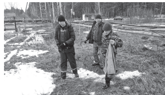
Специалисты ЖКХ выезжали в разные районы посёлка, что бы найти порыв

В субботу вода перестала поступать на верхние этажи в дома на улице Машиностроителей и прилегающей территории. Как стало известно, из-за большой утечки коммунальщики были вынуждены искать место порыва, а власть организовать подвоз воды. Несмотря на упорные поиски, место ЧП удалось обнаружить лишь в понедельник после обеда. В администрации поселка сообщили, что место порыва заметила активная