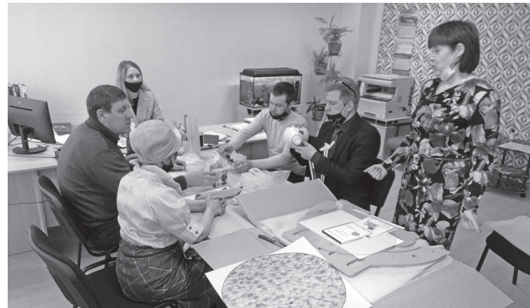
Школа №3 - одна из немногих, где есть мультстудия. Дети точно будут рады