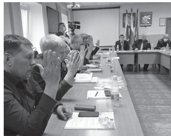
📍 Вчера депутаты проголосовали за изменения в Бюжете