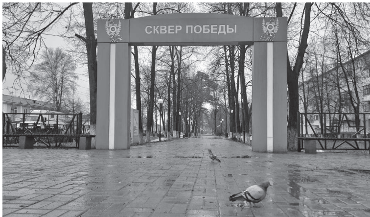
Обустроить Вечный огонь в сквере планируют к 22 июня

Следующий опрос показал, что горожане (более 86% принявших участие в голосовании) считают идеальным местом для Вечного