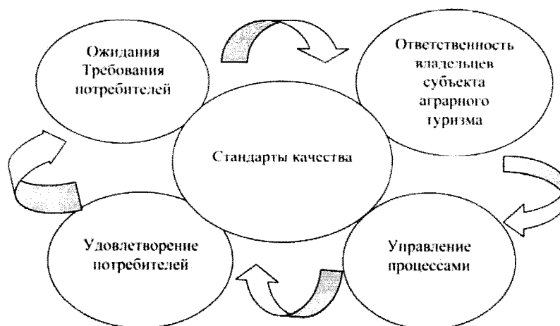
Рис. 6. Модель управления качеством услуг сельского туризма

весь персонал в предоставлении качественной услуги во время личного общения персонала с потребителями. В тех организациях, где присутствует культура, достигается наивысший уровень истинной автономии, создаются условия для поощрения инициативности персонала, желания проявить себя и предлагать нововведения.