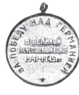
Оборотная сторона медали.