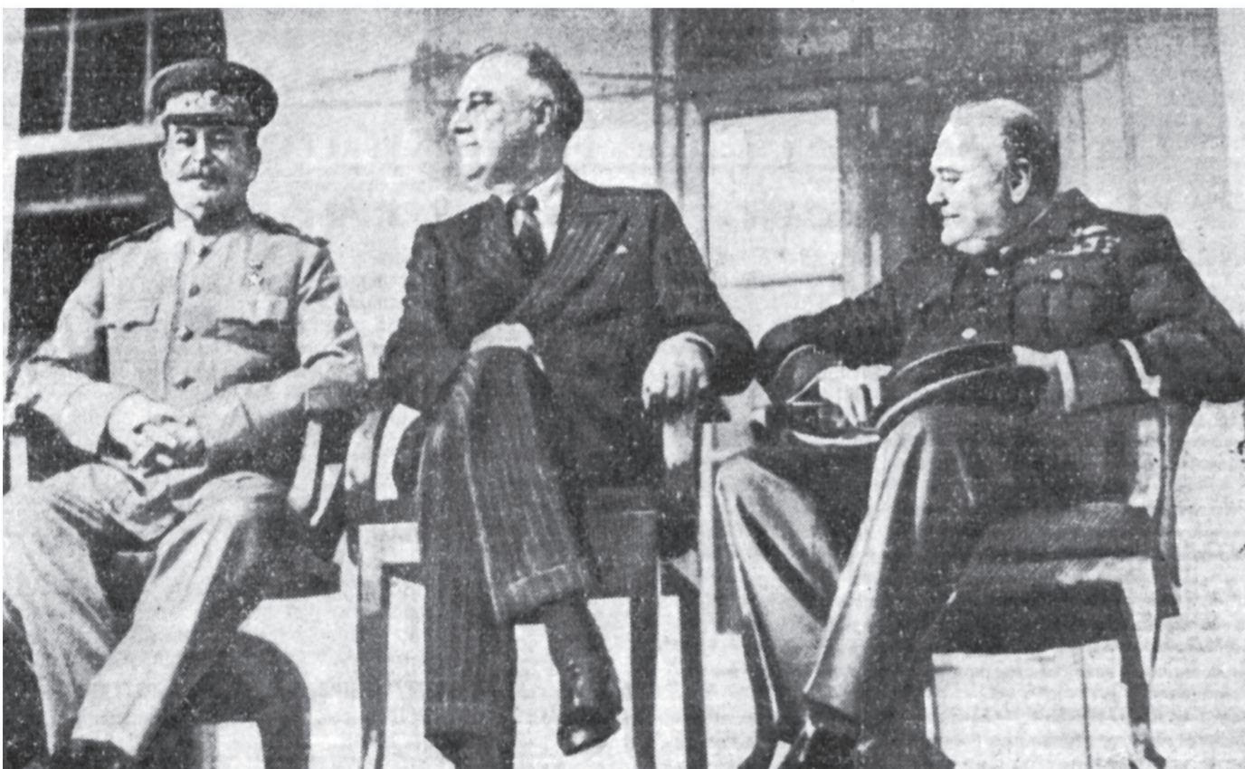
И. В. Сталин, Ф. Д. Рузвельт и У. Черчилль в дни Тегеранской конференции.

ВЕЧНАЯ СЛАВА ГЕРОЯМ, ПАВШИМ В БОЯХ С ВРАГОМ И ОТДАВШИМ СВОЮ ЖИЗНЬ ЗА СВОБОДУ И СЧАСТЬЕ НАШЕГО НАРОДА!