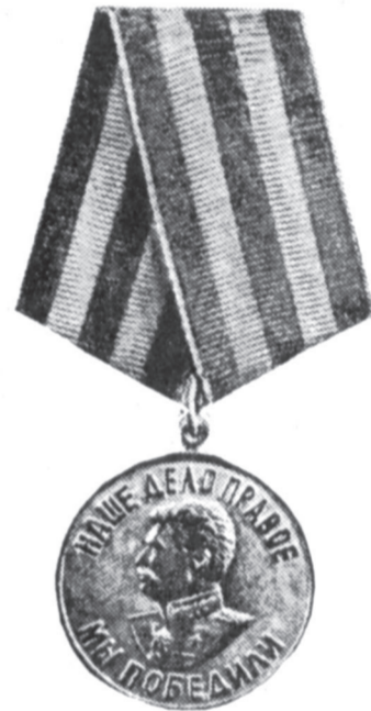
Лицевая сторона медали.

Изображение и надпись на медали выпуклые. Размер медали 32 мм. в диаметре. Медаль при помощи ушка и кольца соединена с пятиугольной колодочкой, обтянутой шелковой муаровой лентой шириной 24 мм. На ленте 5 продольных равных по ширине чередующихся полосок — 3 черной и 2 оранжевой цвета. Край ленты окаймлены узенькими оранжевыми полосками.