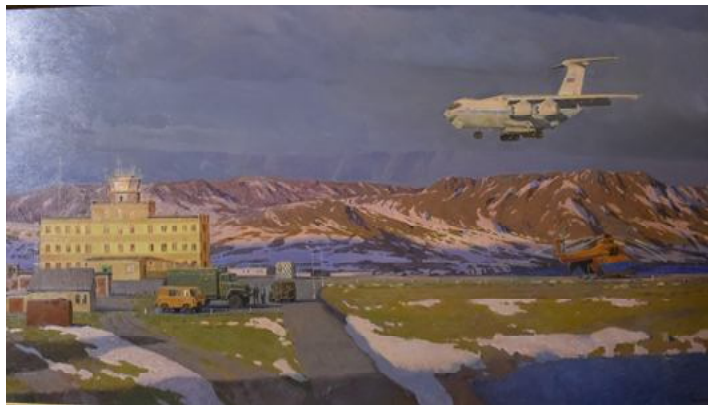
Наш корр. Людмила ШКАРУПА.