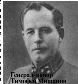
Генерал-майор Тимофей Мишанин

Тимофеева, которые не дрогнули, обороняя город Гродно, капитана Н.Ф. Гастелло, подвиг командира танка сержанта Г.Н.