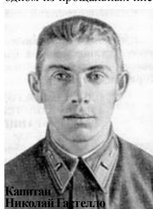
Капитан Николай Гастелло

Эта мысль прекрасно выражена в одном из прощальных писем советского