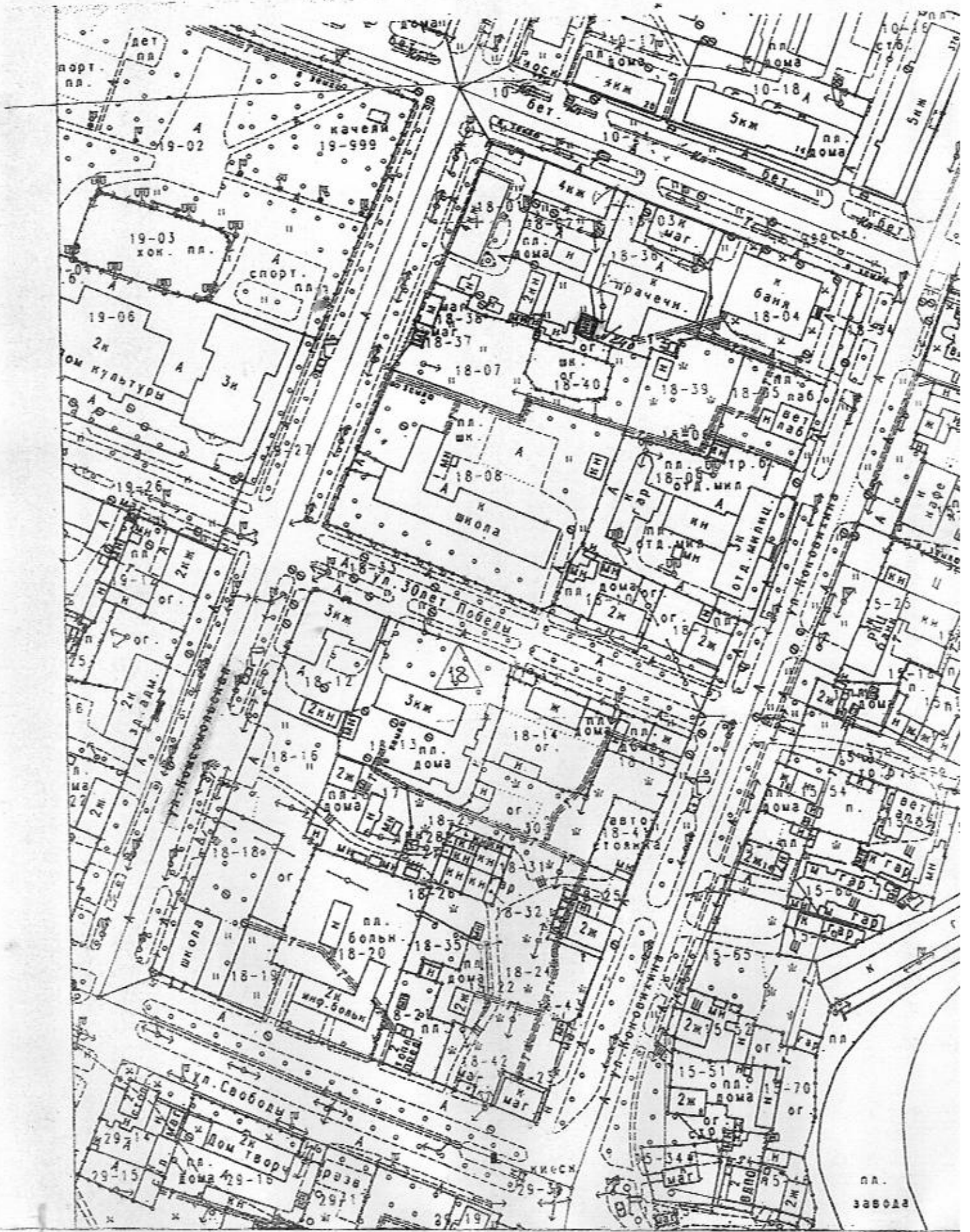
Приложение к постановлению администрации муниципального образования Омутнинское городское поселение от 15.10.2018 № 1018 Графическая часть № 1 схемы размещения нестационарного торгового объекта павильон г. Омутнинск, ул. Комсомольская, 24 б