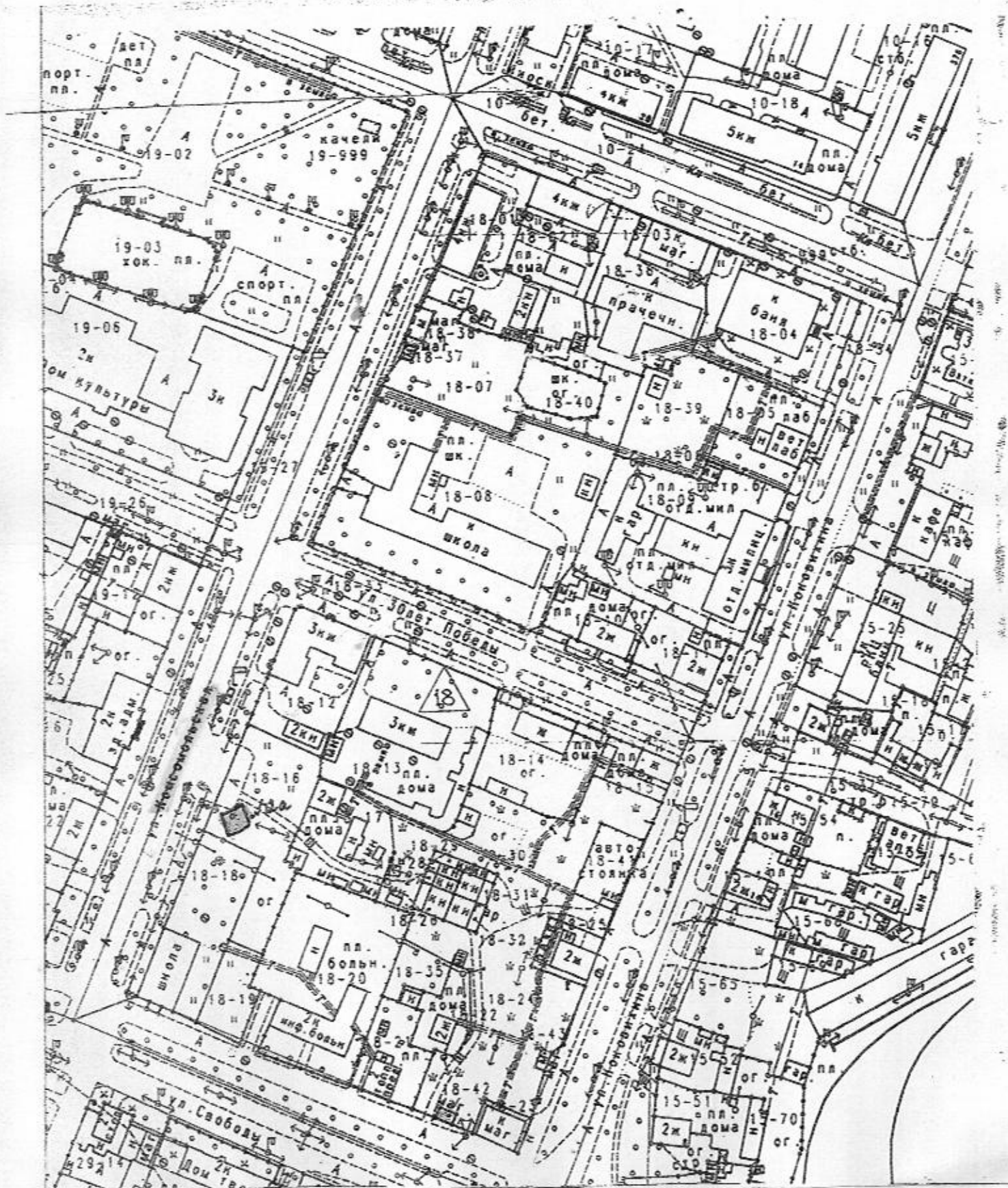
Приложение к постановлению администрации муниципального образования Омутнинское городское поселение от 15.10.2018 № 1018 Графическая часть № 6 схемы размещения нестационарного торгового объекта павильон г. Омутнинск, ул. Комсомольская, 12 а