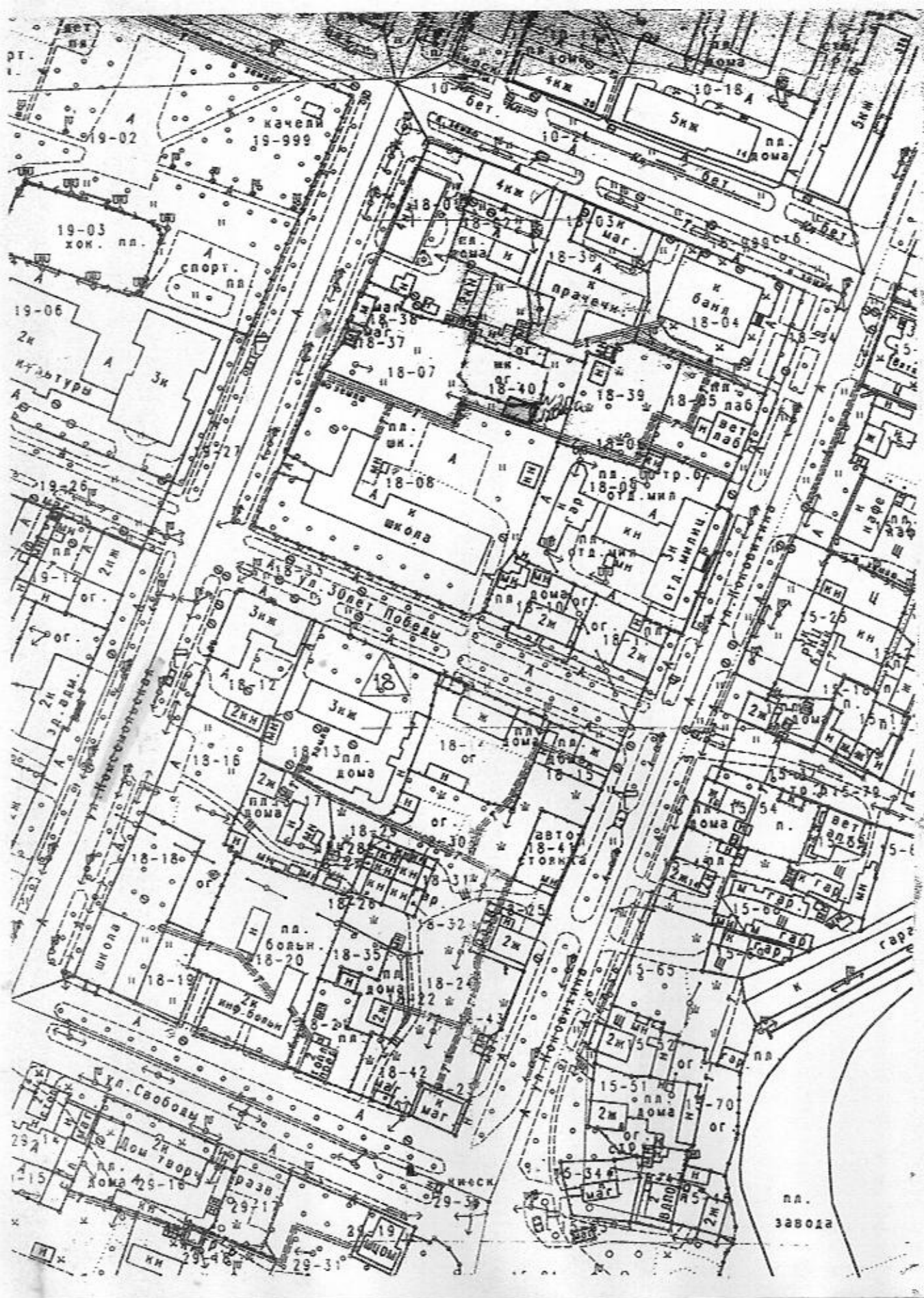
Приложение к постановлению администрации муниципального образования Омутнинское городское поселение от 15.10.2018 № 1018 Графическая часть № 3 схемы размещения нестационарного торгового объекта павильон г. Омутнинск, ул. Комсомольская, 20 а