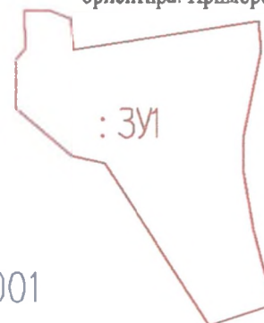
Схема расположения земельного участка на кадастровом плане территории 25:03:040001:3У1 Местоположение установлено относительно ориентира, расположенного за границами участка. Ориентир дом. Участок находится примерно в 100 м по направлению на северо-запад от ориентира. дом Почтовый адрес ориентира: Приморский край, г.Дальнегорск, с.Краснореченский, ул.Пионерская, д,1