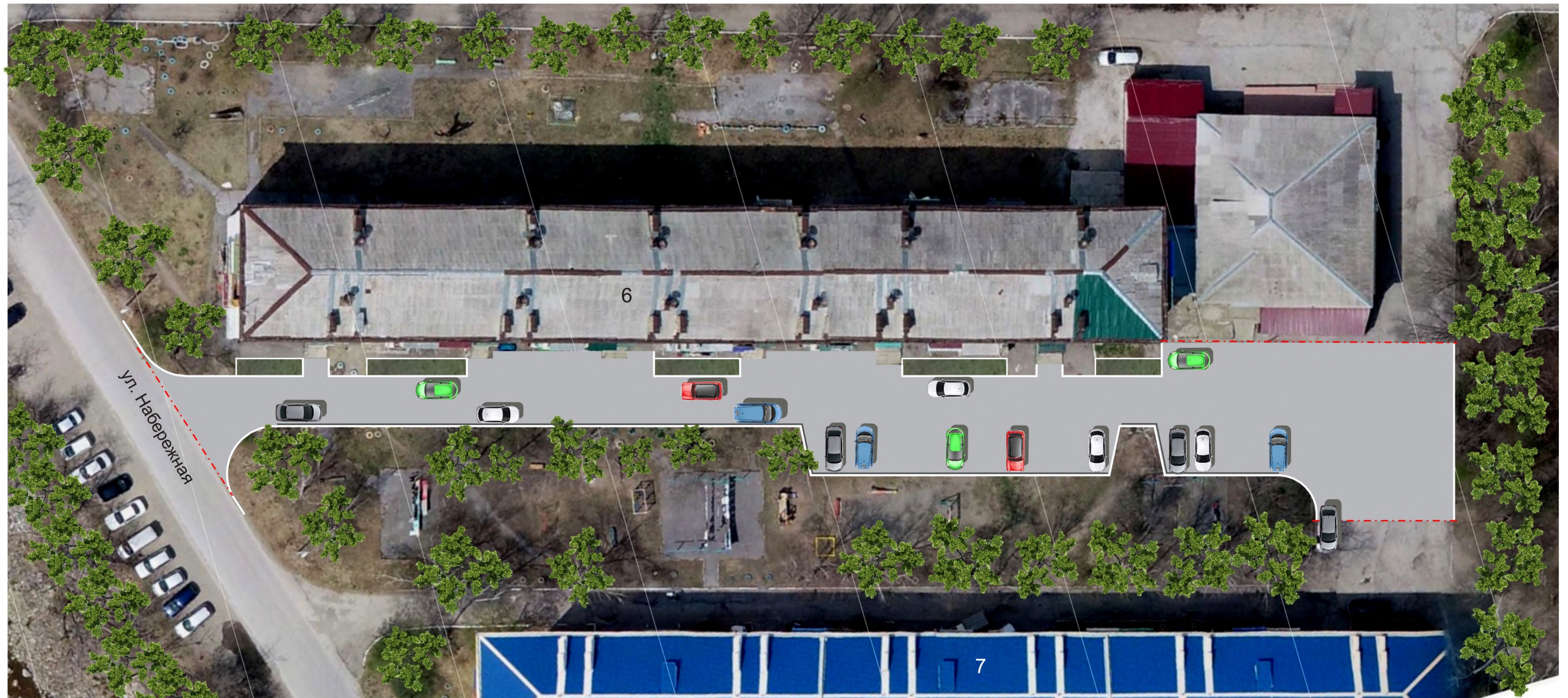
Существующее состояние придомовой территории.